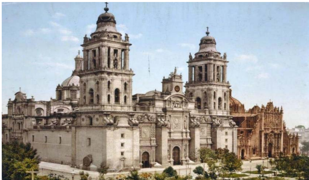
Ο καθεδρικός Ναός της πόλης του Μεξικό

όπου εκτίθενται οι ανεκτίμητοι θησαυροί όλων των προκολομβιανών πολιτισμών της χώρας είναι τα σημεία που θα κεντρίσουν το ενδιαφέρον μας.