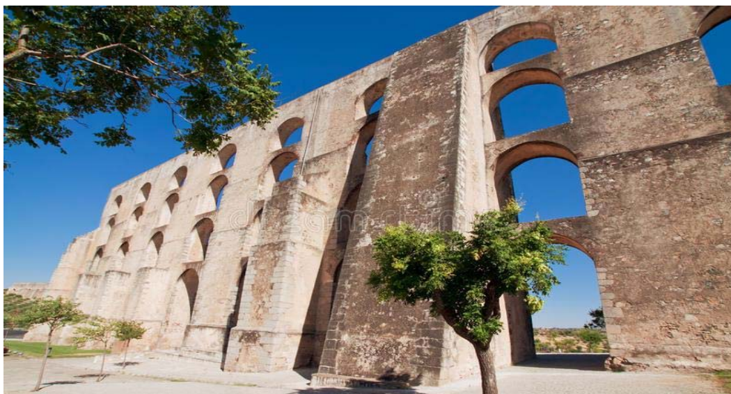
Το υδραγωγείο του Κερέταρο

Το Μεξικό είναι γεμάτο πολιτιστικούς θησαυρούς κι ένας από αυτούς είναι και η πόλη του Κερέταρο, μνημείο πολιτιστική κληρονομιάς της UNESCO!!! Φυσικά θα την επισκεφθούμε, θα δούμε το θαυμάσιο υδραγωγείο της, το θέατρο και το ιστορικό της κέντρο με την Plaza de la Corregidora.