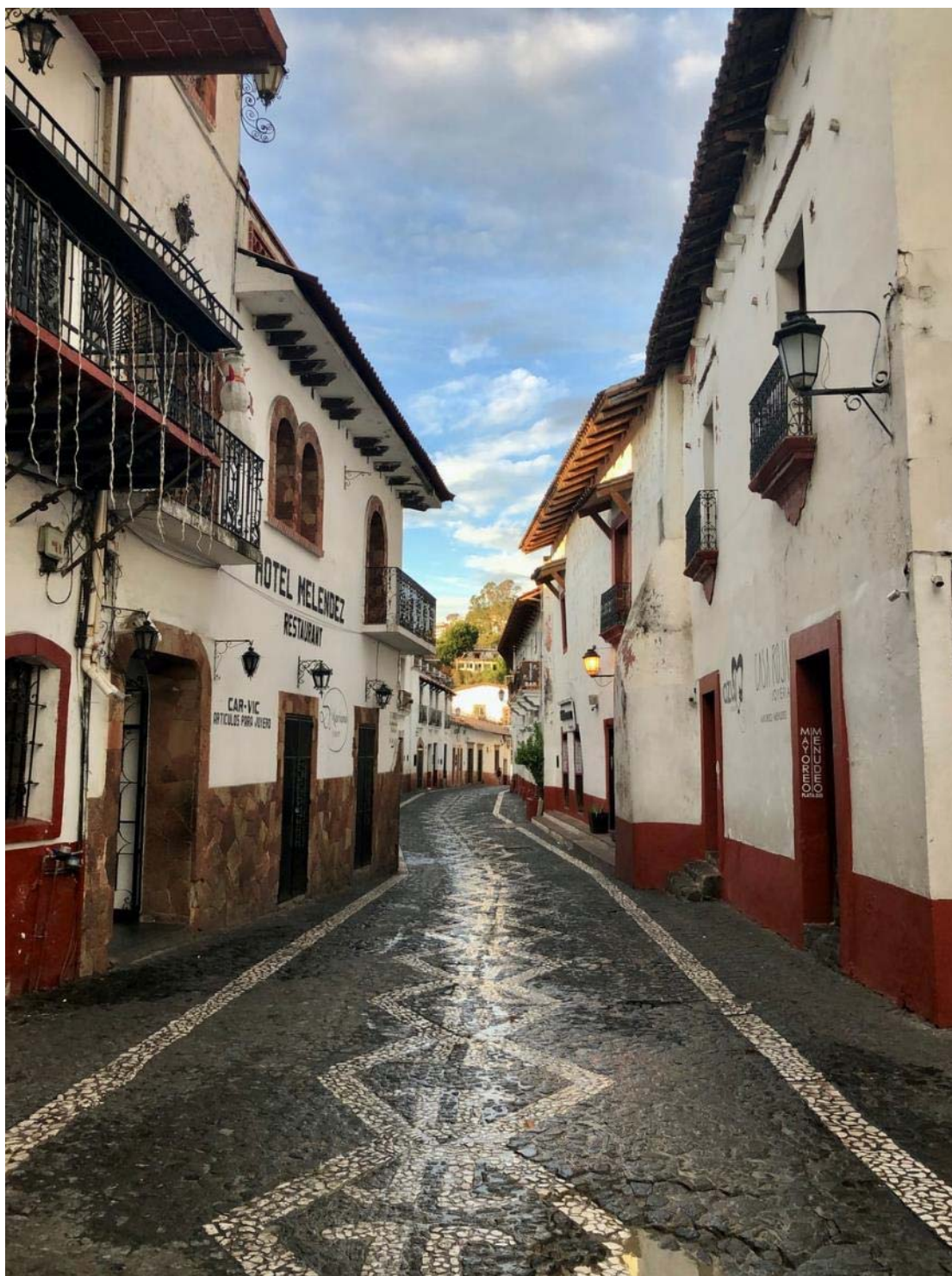
Τάξκο, η πόλη του Ασημιού