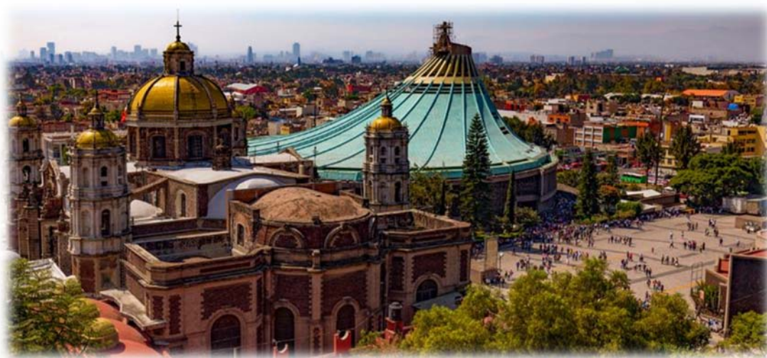
Η παναγία της Γουαδελούπης

Σήμερα αναχωρούμε για τα περίχωρα του Μέξικο Σίτυ, με πρώτη στάση στην παγκοσμίως διάσημη εκκλησία της Παναγίας της Γουαδελούπης, το σημαντικότερο προσκύνημα του καθολικού κόσμου της αμερικανικής ηπείρου. Οι τέσσερις εμφανίσεις της "Virgen Morena" (Μελαχρινή Παρθένα) στον Ινδιάνο Χουάν Ντιέγκο, αποτελούν την αιτία κατασκευής τής εν λόγω μεγαλόπρεπης βασιλικής, όπου φυλάσσεται το "tilma" (μανδύας από ίνες "agate", ένα χοντρό ύφασμα κατασκευασμένο από φύλλα κάκτου) και η θαυματουργή εικόνα της Μαύρης Παναγίας.