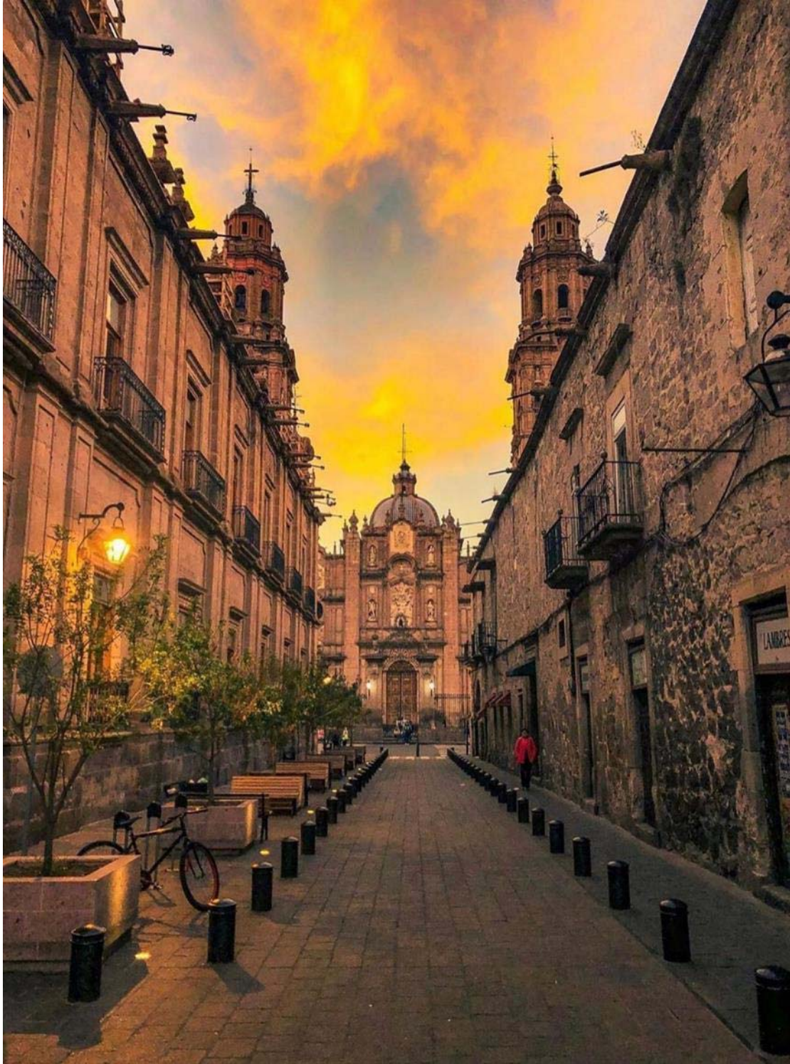
Μορέλια, η πόλη κόσμημα του βορρά!

Μία από τις πιο όμορφες επαρχιακές πόλεις του Μεξικού. Πραγματικό υπαίθριο μουσείο αρχιτεκτονικής, με υπέροχους πλακόστρωτους δρόμους, μέγαρα, εκκλησίες, καταστήματα. Θα δούμε το κυβερνητικό μέγαρο, του 1770, την πλατεία των Όπλων, το Μέγαρο Κλαβιχέρο και το υδραγωγείο του 18ου αι. Μετά την ξενάγηση θα επιστρέψουμε στην πρωτεύουσα Μέξικο Σίτυ.