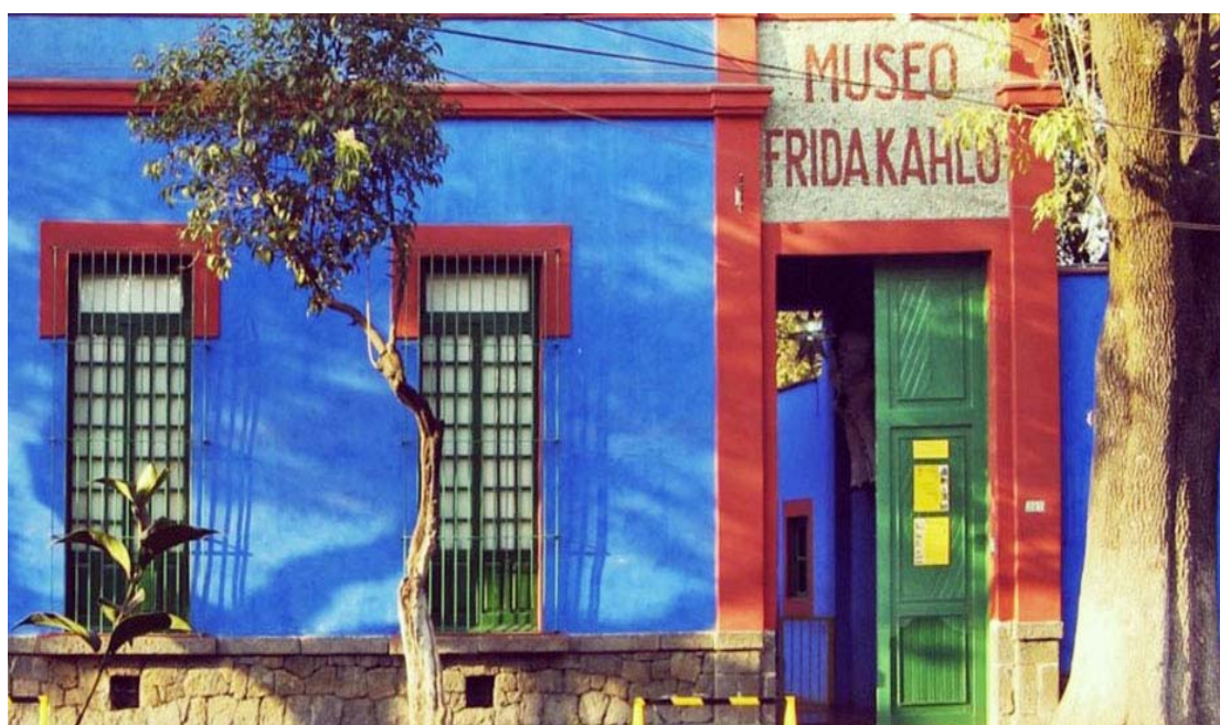
Το σπίτι της Φρίντα Κάλο

Στη συνέχεια μας περιμένει μια κρουαζιέρα στα κανάλια του Χοτσιμίλκο που βρίσκονται στην νοτιοανατολική πλευρά της πρωτεύουσας. Εξάλλου όπως έχουμε πει ολόκληρη η πόλη του Μεξικό είναι χτισμένη πάνω σε μια λίμνη! Τα κανάλια είναι ό,τι απόμεινε από την αποξήρανση της λίμνης ενώ η υποχώρηση του νερού δημιούργησε μικρά τεχνητά νησάκια που σήμερα ονομάζονται τσινάμπας! Κι επειδή οι Μεξικάνοι έχουν τη χαρά της ζωής στο αίμα τους, εδώ στο Χοτσιμίλκο, μέσα σε πολύχρωμες βάρκες τραγουδούν με τα σομπρέρος τους και τις πολύχρωμες φορεσιές τους, βάσανα κι αγάπες σε μελωδικούς σκοπούς! Με μια τέτοια «κρουαζιέρα» με συνοδεία μουσικής θα αποχαιρετήσουμε το Μεξικό. Το βράδυ γεμάτοι εικόνες θα επιβιβαστούμε στο αεροπλάνο όπου μέσω ενδιάμεσου σταθμού θα επιστρέψουμε στην Ελλάδα.