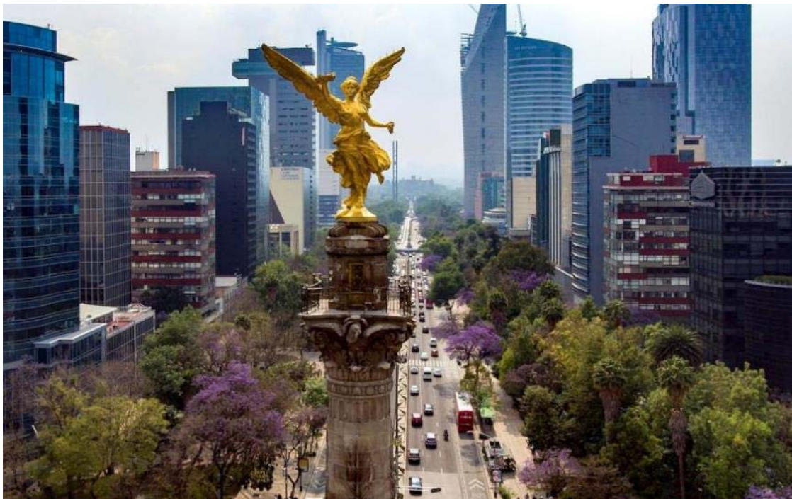
Paseo de la Reforma, Mexico City

Αναχώρηση για το Μέξικο Σίτυ, την πρωτεύουσα της χώρας και μεγαλύτερο αστικό κέντρο του κόσμου με 25 εκατομμύρια ανθρώπους! Μεγάλη, χασκική αλλά και όμορφη, χτισμένη στα 2.250 μέτρα εκεί που κάποτε υπήρχε μια λίμνη! Εκεί που κάποτε οι Αζτέκοι είχαν μεγαλοουργήσει. Εκεί που η ιστορία μπλέκεται με τον μύθο. Αυτές τις κρυμμένες ομορφιές θα ανακαλύψουμε στο μεστό πρόγραμμα που ακολουθεί.