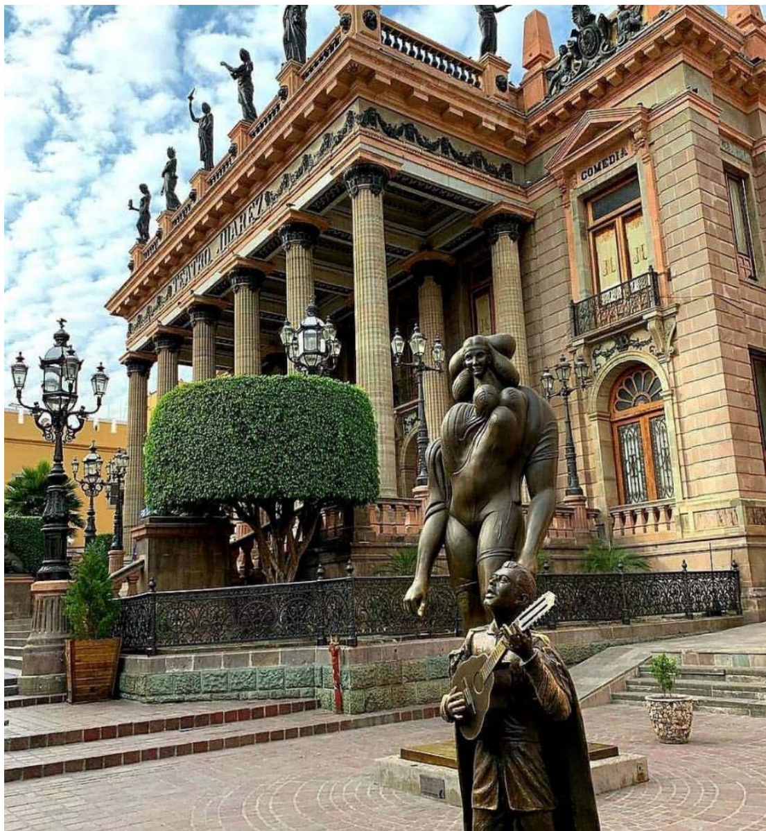
Το θέατρο Χουάρεζ

Μετά το πρωινό θα απολαύσουμε το γραφικό Γουαναχουάτο, άλλη μία πόλη που γεννήθηκε λόγω του ασημιού. Μια πόλη που ανήκει φυσικά στη λίστα της παγκόσμιας πολιτιστικής κληρονομιάς της UNESCO!!! Η ξενάγησή μας θα μας αποκαλύψει μία αμφιθεατρική πόλη με ήσυχα στενά δρομάκια, καλοδιατηρημένες πλατείες και υπέροχα αποικιακά αρχοντικά. Θα περπατήσουμε στις γραφικές αποικιακές αλέες και στις υπέροχες πλατείες, μοναδικές στη χώρα του Μεξικού. Θα δούμε το Πανεπιστήμιο, το θέατρο Χουάρεζ και θα απολαύσουμε τη θέα από το άγαλμα του Πίπιλα όπου θα ανέβουμε με τελεφερίκ.