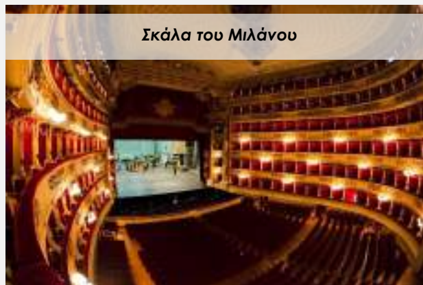
Σκάλα του Μιλάνου

Πρωινό στο ξενοδοχείο και μεταφορά στο αεροδρόμιο της Νίκαιας όπου θα επιβιβαστούμε στην πτήση της επιστροφής.