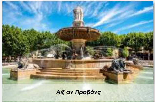
Αιξ αν Προβάνς