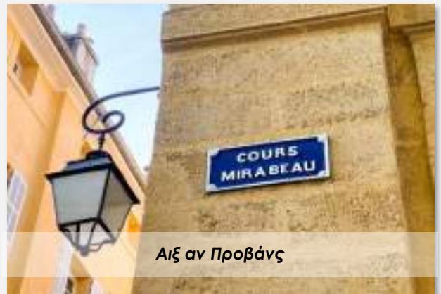
Αιξ αν Προβάνς