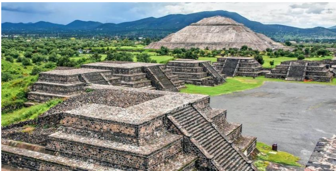
Ο αρχαιολογικός χώρος του Τεοτιχουακάν

Επόμενη στάση στον μυστηριώδη αρχαιολογικό χώρο του Τεοτιχουακάν. Βρίσκεται 40 χιλιόμετρα βορειοανατολικά της πρωτεύουσας και έως την δεκαετία του 1920 ελάχιστα πράγματα ήταν γνωστά για την περιοχή. Ανάμεσα στα 150 π.Χ. και 500 μ.Χ., ένας άγνωστος πολιτισμός της Κεντρικής Αμερικής έχτισε σε αυτό το οροπέδιο των 22 τετ. χλμ., μια εκθαμβωτική μητρόπολη, την Τεοτιχουακάν. Σήμερα, η αρχαιολογική μελέτη κατάφερε να αναπαραστήσει με απόλυτη πιστότητα την χιλιόχρονη ιστορία της αρχαίας μητρόπολης και έτσι μπορούμε να θαυμάσουμε τις επιβλητικές πυραμίδες του Ήλιου και της Σελήνης, την λεωφόρο των Νεκρών και τα κτερίσματα από οψιδιανό, που έφερε στο φως η αρχαιολογική σκαπάνη. Αργά το απόγευμα θα καταλήξουμε στο Κερέταρο όπου θα μας φιλοξενήσει απόψε.