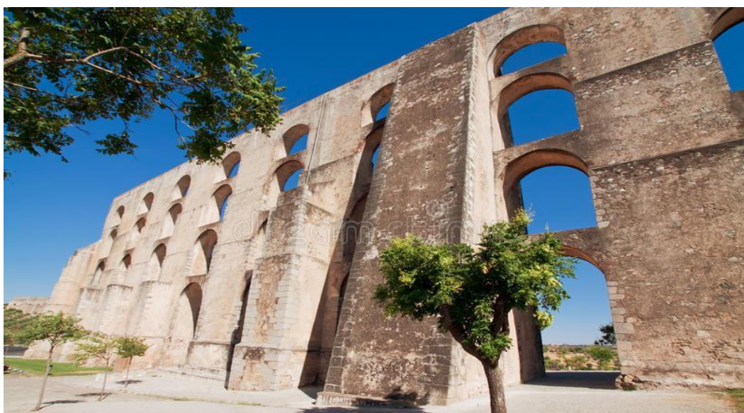
Το υδραγωγείο του Κερέταρο

Το Μεξικό είναι γεμάτο πολιτιστικούς θησαυρούς κι ένας από αυτούς είναι και η πόλη του Κερέταρο, μνημείο πολιτιστική κληρονομιάς της UNESCO!!! Φυσικά θα την επισκεφθούμε, θα δούμε το θαυμάσιο υδραγωγείο της, το θέατρο και το ιστορικό της κέντρο με την Plaza de la Corregidora.