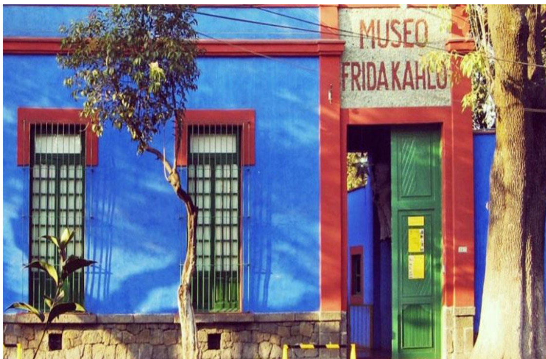
Το σπίτι της Φρίντα Κάλο

Στη συνέχεια μας περιμένει μια κρουαζιέρα στα κανάλια του Χοτσιμίλκο που βρίσκονται στην νοτιοανατολική πλευρά της πρωτεύουσας. Εξάλλου όπως έχουμε πει ολόκληρη η πόλη του Μεξικό είναι χτισμένη πάνω σε μια λίμνη! Τα κανάλια είναι ό,τι απόμεινε από την αποξήρανση της λίμνης ενώ η υποχώρηση του νερού δημιούργησε μικρά τεχνητά νησάκια που σήμερα ονομάζονται τσινάμπας! Κι επειδή οι Μεξικάνοι έχουν τη χαρά της ζωής στο αίμα τους, εδώ στο Χοτσιμίλκο, μέσα σε πολύχρωμες βάρκες τραγουδούν με τα σομπρέρος τους και τις πολύχρωμες φορεσιές τους, βάσανα κι αγάπες σε μελωδικούς σκοπούς! Με μια τέτοια «κρουαζιέρα» με συνοδεία μουσικής θα αποχαιρετήσουμε το Μεξικό. Το βράδυ γεμάτοι εικόνες θα επιβιβαστούμε στο αεροπλάνο όπου μέσω ενδιάμεσου σταθμού θα επιστρέψουμε στην Ελλάδα.