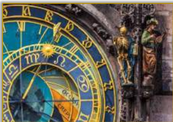
Λεπτομέρεια της παράξενης αρχιτεκτονικής της Πράγας που συμβαδίζει με την πλούσια Ιστορία της: Ένας σκελετός κοσμή το Αστρονομικό Ρολόι της πόλης

Όμως οι κάτοικοι της πόλης δεν φοβούνταν τα τέρατα και είχαν τσαγανό. Αυτό αποδεικνύουν οι δύο Εκπαραθυρώσεις της Πράγας (1419 και 1618) στις