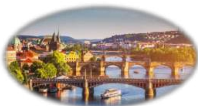
Η πανέμορφη παλιά πόλη της Πράγας, μνημείο της UNESCO, πάνω στον ποταμό Μολδάβα

Ακόμα κι αν δεν έχεις πάει στην Πράγα, σίγουρα έχεις μία εικόνα της. Έχεις δει σε φωτογραφίες τις χρυσές στέγες της. Έχεις δει τα παράξενα γοτθικά κτήρια με τα τερατόμορφα στολίδια που δεν καταλαβαίνεις αν σχεδιάστηκαν από τους αρχιτέκτονες πριν αιώνες για να τρομοκρατούν τους περαστικούς ή για να χλευάσουν την καταπίεση της Αγίας Ρωμαϊκής Αυτοκρατορίας. Επίσης ξέρεις από την Πράγα το Μαύρο Θέατρο, τον Κάφκα, τον Κούντερα. Και βέβαια έχεις ακουστά την Άνοιξη της Πράγας και τη Βελούδινη Επανάσταση... Όλα αυτά δεν είναι λίγα. Όλα αυτά, μαζί με ό,τι πούμε παρακάτω για τη γοητευτική αυτή πρωτεύουσα της Τσεχίας, δείχνουν ότι η Πράγα είναι μία πόλη που ανά τους αιώνες χορεύει με την ιστορία – και μάλιστα διαλέγει μόνη της τα βήματα αυτού του χορού.