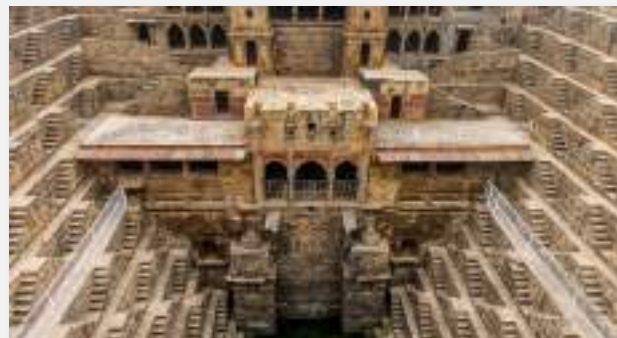
Μπαορι στο Αμπανέρι