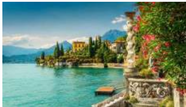
Θέα της Λίμνης Κόμο από τη βίλα Μοναστέρο