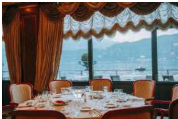
HOTEL SPLENDID – Str. Nazionale del Sempione, 12, 28831 Baveno VB