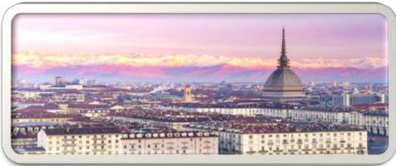
Γενική άποψη του Τορίνο, με τον Πύργο Αντονελιάνα να ξεχωρίζει. Στο βάθος φαίνονται οι χιονισμένες Ιταλικές Άλπεις

Πάντως η φράση του ντε Κίρικο που αναφέραμε στην αρχή, οφείλεται μάλλον στη βαριά ομίχλη, που πλακώνει μερικές φορές το Τορίνο και το κάνει να μοιάζει με πόλη-φάντασμα.