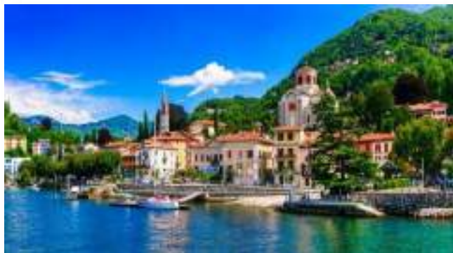
Η γραφική κωμόπολη Λαβένο Μπομπέλο στη Λίμνη Ματζόρε

Λίμνη Βαρέζε. Με πολλές βίλες, πανέμορφες και κλασσικές. Στη λίμνη υπάρχει και το νησάκι Βιρτζίνια με αρχαιολογικά ευρήματα αλλά και πλούσια βλάστηση. Στις όχθες επίσης υπάρχει ζωολογικός κήπος. Οι γύρω περιοχές γενικώς ενδείκνυται για περιπάτους.