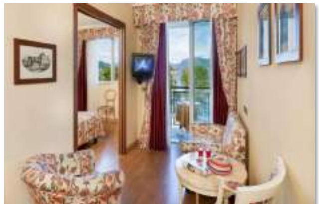
RESIDENCE CARL & DO – Via Carlo Zacchera 2, Str. Nazionale del Sempione, 25, 28831 Baveno