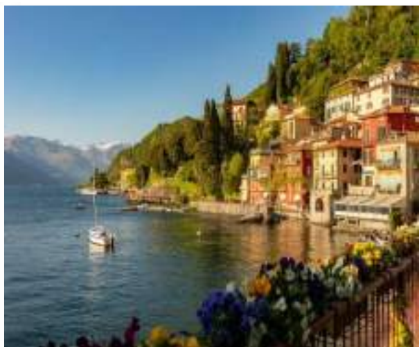
Λίμνη Κόμο με τα τυπικά σπίτια της περιοχής

Τζορτζ Κλούνεϊ, Μαντόνα, Σιλβέστερ Σταλόνε, Τζιάνι Βερσάτσε, Ροναλντίνιο... όλοι έχουν από ένα σπίτι στη Λίμνη Κόμο της Βόρειας Ιταλίας. Γιατί; Οι λίμνες αυτές κατ' αρχάς είναι τόσο όμορφες και τόσο γραφικές που μοιάζουν να βγήκαν από παραμύθι. Γι αυτό και ανέκαθεν αποτελούσαν πόλο έλξης της ιταλικής αριστοκρατίας, που έχτιζε εκεί τα μεγαλοπρεπή εξοχικά της.