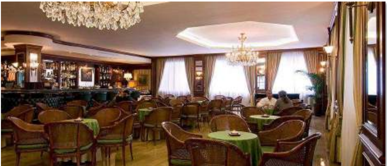
GRAND HOTEL BRISTOL – Corso Umberto I, 73, 28838 Stresa VB