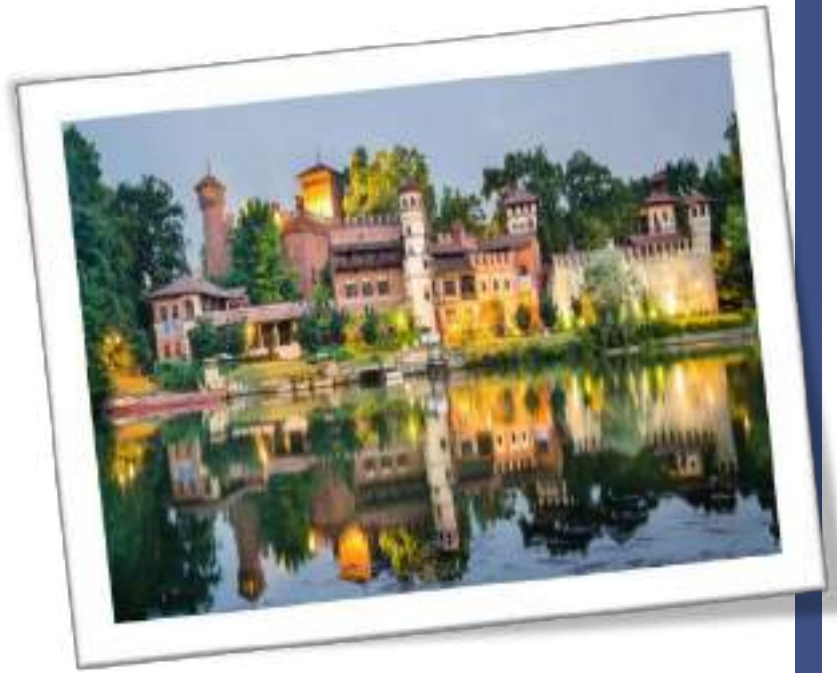
Το Μεσαιωνικό Κάστρο που είναι χτισμένο μέσα στην πόλη του Τορίνο

Οι στοές βρίσκονται παντού σε όλη την πόλη. Στο Τορίνο δεν σε νοιάζει αν θα βρέξει.