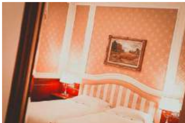
HOTEL SIMPLON – Corso Giuseppe Garibaldi, 52, 28831 Baveno VB